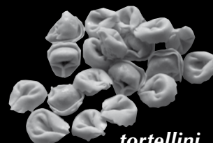
tortellini 39 Kč