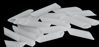
penne 29 Kč