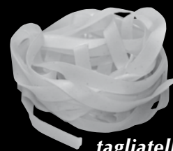
tagliatelle 39 Kč