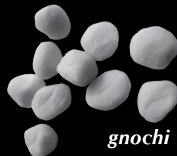
gnochi 29 Kč